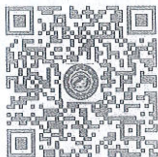
全国农民科学素质网络 知识竞赛公众号