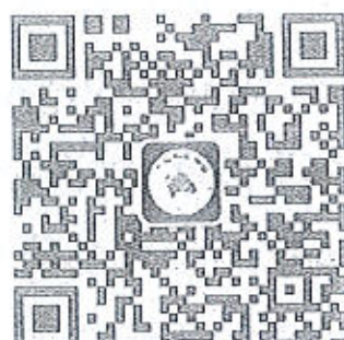
三农科学传播 公众号